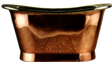
Außen Kupfer, innen Nickel – Drummonds fertigt seine ikonische Badewanne jetzt auch als Mini-Version: „Baby Tyne“, 5940 Pfund. drummonds-uk.com