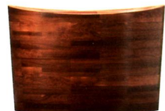
Mit sanft ansteigendem Rand hält die japanisch inspirierte Nussbaum-Sitzwanne „True Ofuro“ jede Badewelle im Zaum, 38 000 Euro. aquaticabath.eu