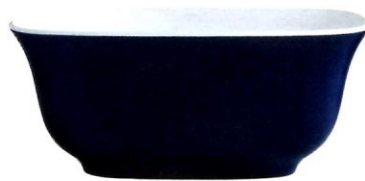
In die Fluten steigen: „Amiata“ aus Quarrycast, einem Gemisch aus vulkanischem Kalkstein und hochwertigen Harzen, ab 4130 Euro. vandabaths.com